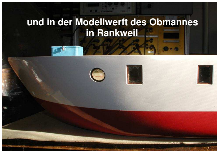
und in der Modellwerft des Obmannes in Rankweil

Aber in den „Chefetagen“ der Clubs wird schon eifrig an den Ausschreibungen für Schaufahren und Wettbewerbe geplant und dieselben vom NRC Pratteln, von den MSF Lahr und vom 1. VSMC sind schon den Mitgliedern zugestellt worden. Sehr erfreulich ist, dass heuer auch wieder ein Schaufahren des SMC Winterthur am Schützenweiher im Juni geplant ist und dieses traditionsreiche Schaufahren eine Fortsetzung findet.