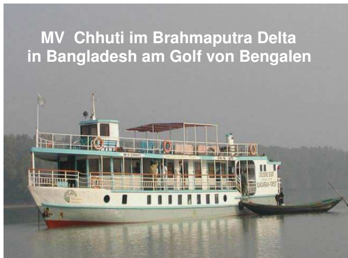
MV Chhuti im Brahmaputra Delta in Bangladesh am Golf von Bengalen

sind ja in der glücklichen Lage, unsere Freizeit in unserer Modellwerft sinnvoll verbringen zu können und dazu nach getaner Arbeit ein Erfolgserlebnis genießen können!